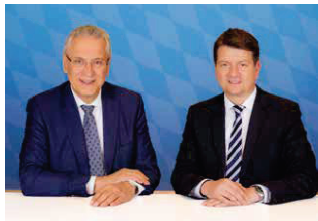
Joachim Herrmann, MdL Staatsminister

Bayern baut die Arbeitsgelegenheiten seit Jahren konsequent aus. Mit diesem Leitfaden wollen wir alle potentiellen Träger ermutigen, Arbeitsgelegenheiten nach dem Asylbewerberleistungsgesetz zu schaffen.